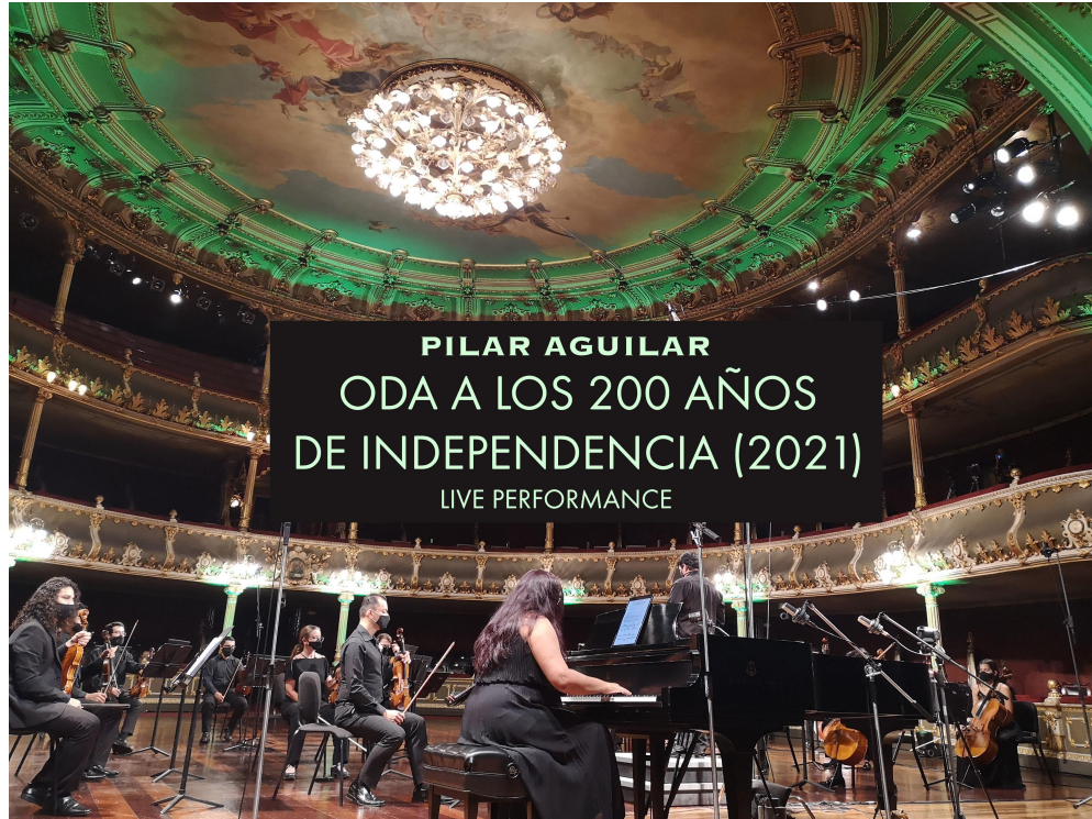
Oda a los 200 años de independencia obra estrenada en abril de 2021 por la OSH, con Rebeca Ordoñez, solista al piano